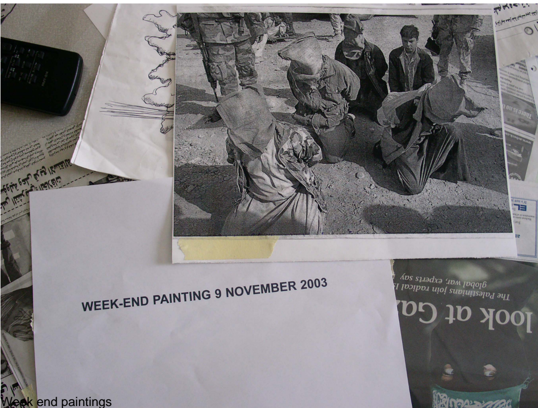
Week end paintings