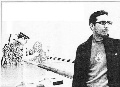
Mit dem Modemedium Video gelang dem Marokkaner Mounir Fatmi der Sprung an internationale Festivals.

Zugleich stellen im Migros-Museum «Art & Language» aus. Bis 4./7. Januar 2004.