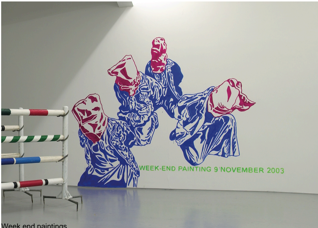
Week end paintings

Weekend Paintings, as their name suggests, are decided upon and produced during the weekend, when two conditions are met: one, the possibility for the artist to work in situ, in the context of a exhibit, personal or not, or of a particular project, and two, when the news happening that weekend calls for a reaction from the artist.