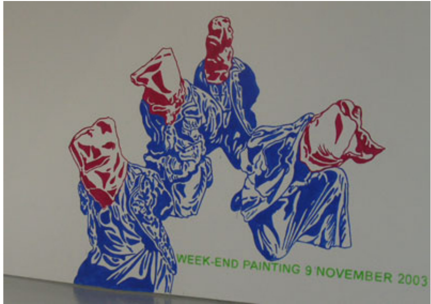
2002-2005, wall painting, in situ. Exhibition view from Obstacles, Next flag, Migros Museum, 2003, Zürich.