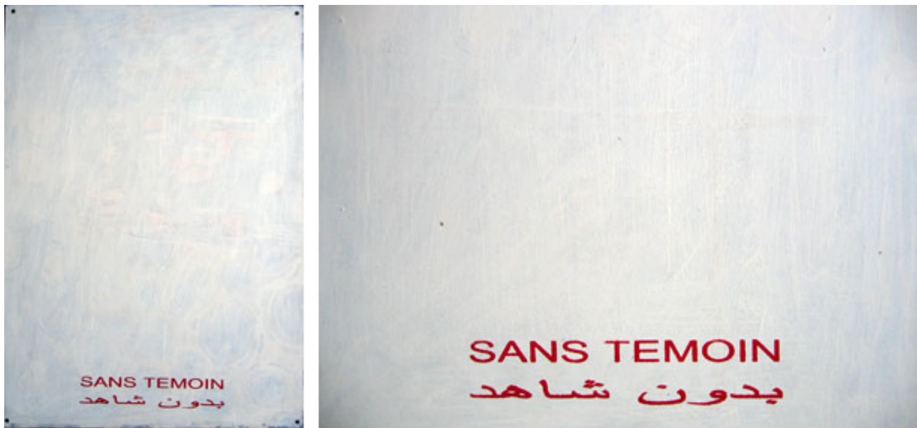
Paintings started in 1996, paintings from 1995, erased in 1996. Exhibition view from Comprendra bien qui comprendra le dernier, CAC Le Parvis, 2004, Ibos.

Projet conceptuel inscrit dans une série procédant par l'application sur des toiles de plusieurs couches de peinture blanche, « Sans Témoin » est associé aux œuvres « Coma », ou encore « Effacement Mémoire » réalisées entre 1995 et 2003. Les supports de ces compositions monochromes obtenues par recouvrement sont constitués au départ par des tableaux réalisés et exposés antérieurement par l'artiste, au style proche de l'abstraction et de la figuration libre, qui ont bénéficié de la reconnaissance du milieu artistique et de la critique. « Sans Témoin » est une série d'œuvres peintes et effacées qui privent le public de la possibilité de les voir dans leur état originel et suppriment le spectateur au sein de la chaîne de création et de monstration. Seul le titre de la série, sérigraphié en français et en arabe en lettres rouges et à même la toile, en quelque sorte estampillé, atteste de l'existence d'œuvres avant leur effacement.