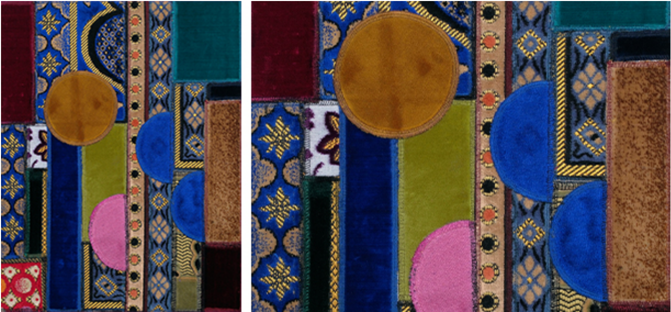
2023-2024, collage with prayer rugs on canvas, 40 x 50 cm. Courtesy of the artist.