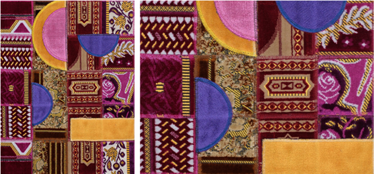
2023-2024, collage with prayer rugs on canvas, 40 x 50 cm. Courtesy of the artist.