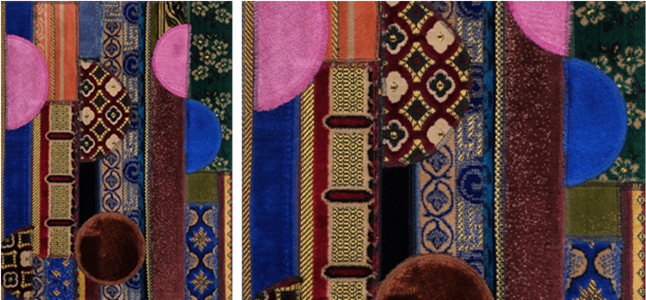
2023-2024, collage with prayer rugs on canvas, 40 x 50 cm.