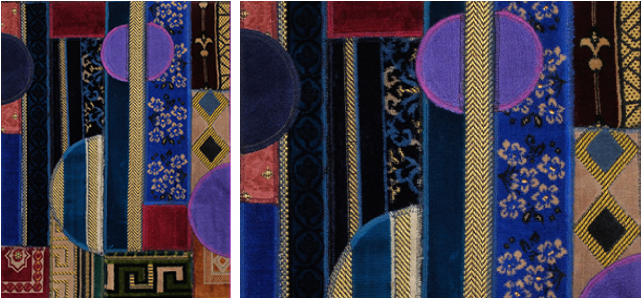
2023-2024, collage with prayer rugs on canvas, 40 x 50 cm. Courtesy of the artist.