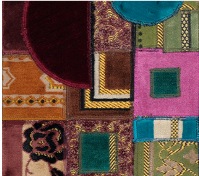
2023-2024, collage with prayer rugs on canvas, 50 x 50 cm.