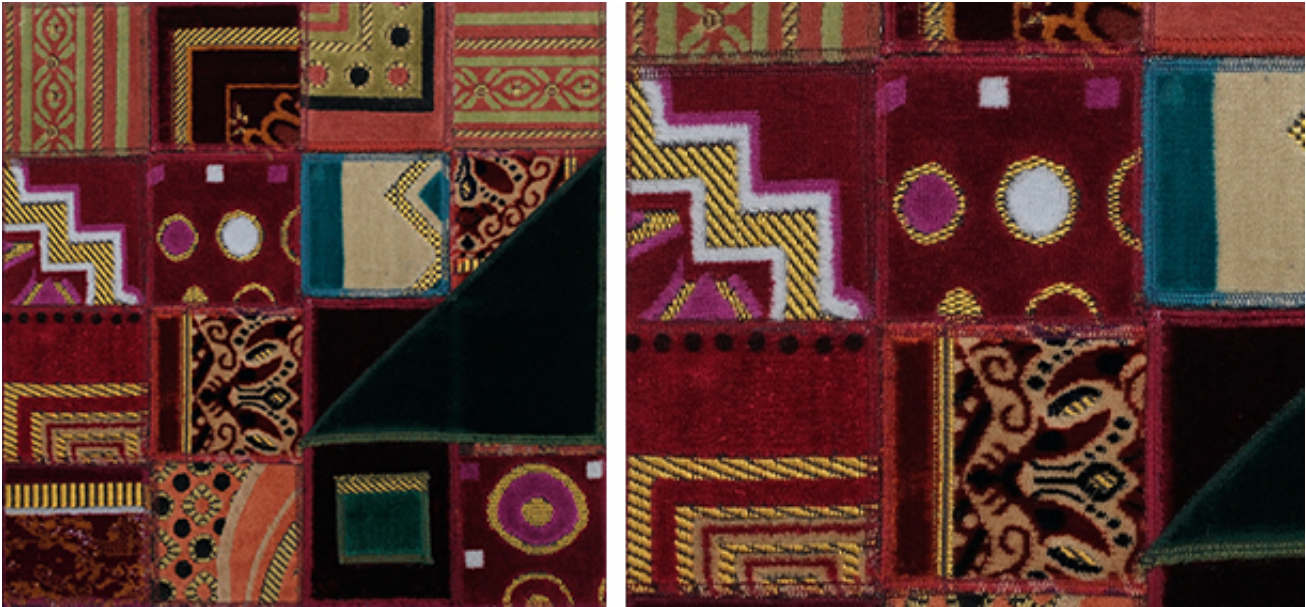
2023-2024, collage with prayer rugs on canvas, 40 x 40 cm. Courtesy of the artist.