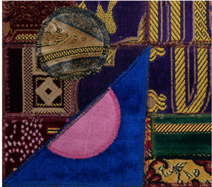
2023-2024, collage with prayer rugs on canvas, 40 x 40 cm. Courtesy of the artist.