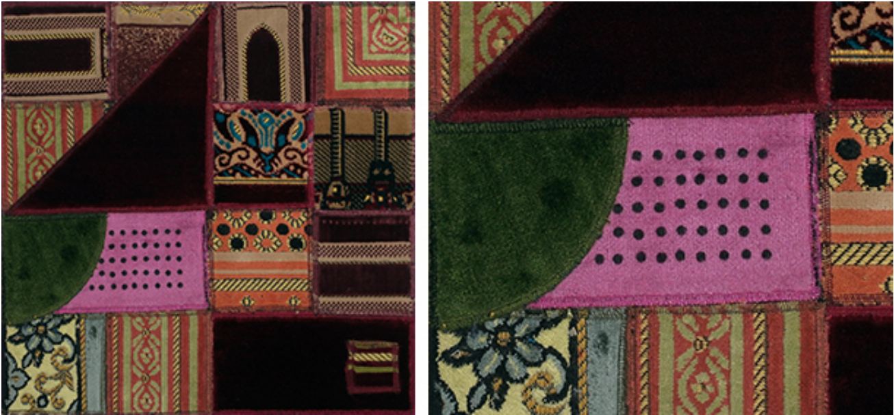
2023-2024, collage with prayer rugs on canvas, 40 x 40 cm. Courtesy of the artist.