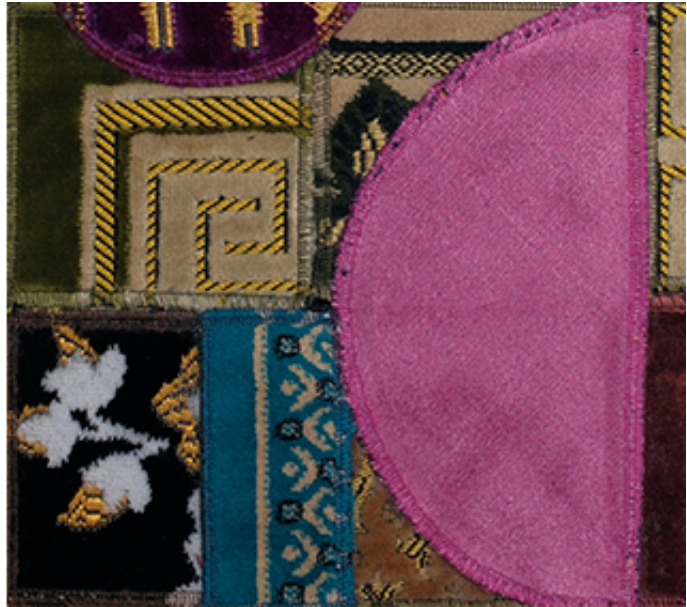
2023-2024, collage with prayer rugs on canvas, 30 x 30 cm. Courtesy of the artist.