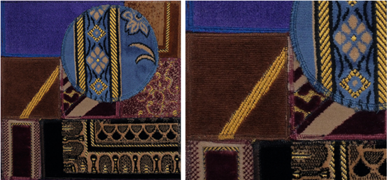
2023-2024, collage with prayer rugs on canvas, 30 x 30 cm.