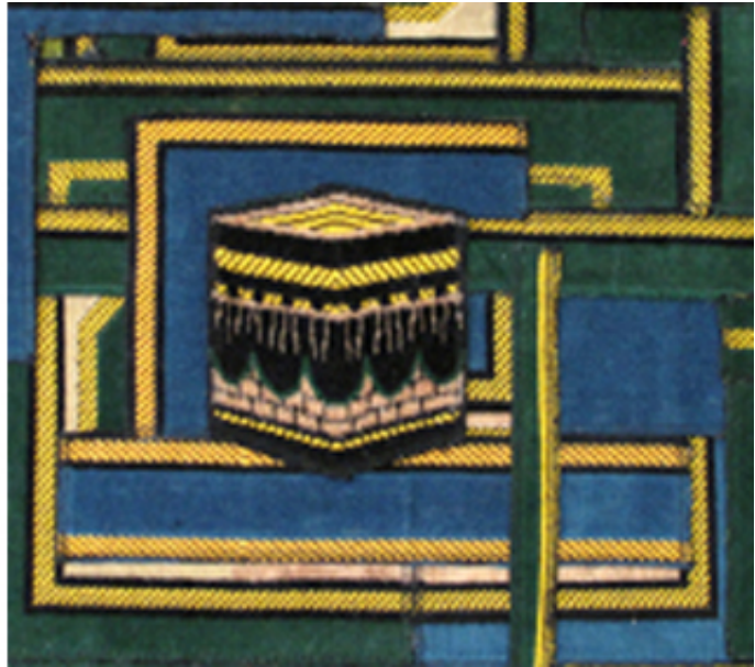
2011, collage with prayer rugs, 80 x 80 cm. Exhibition view from Moving Art, Analix Forever, 2018, Geneva.

En 2011, mounir fatmi a commencé à travailler sur une série de collages intitulés Labyrinthe , composés en utilisant des morceaux découpés de tapis de prière islamiques. Au sein des six collages qui forment cette série non achevée, on trouve une esthétique architecturale forte, avec des éléments évoquant des frontons, colonnes, plans et ornements, et pourtant chaque œuvre est visuellement très distincte des autres.