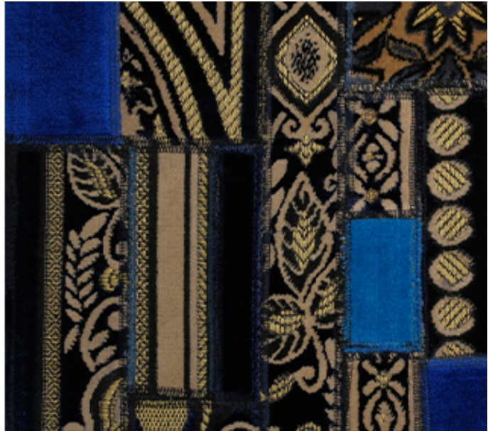
2023-2024, collage with prayer rugs, 40 x 40 cm.