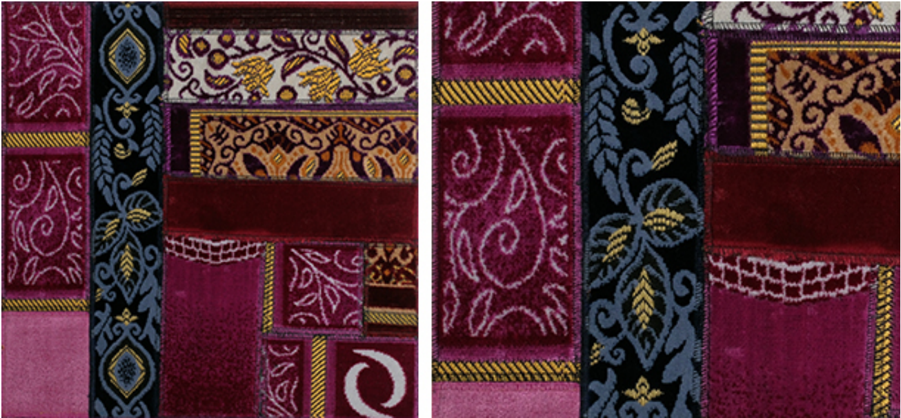
2023-2024, collage with prayer rugs, 40 x 40 cm. Courtesy of the artist.