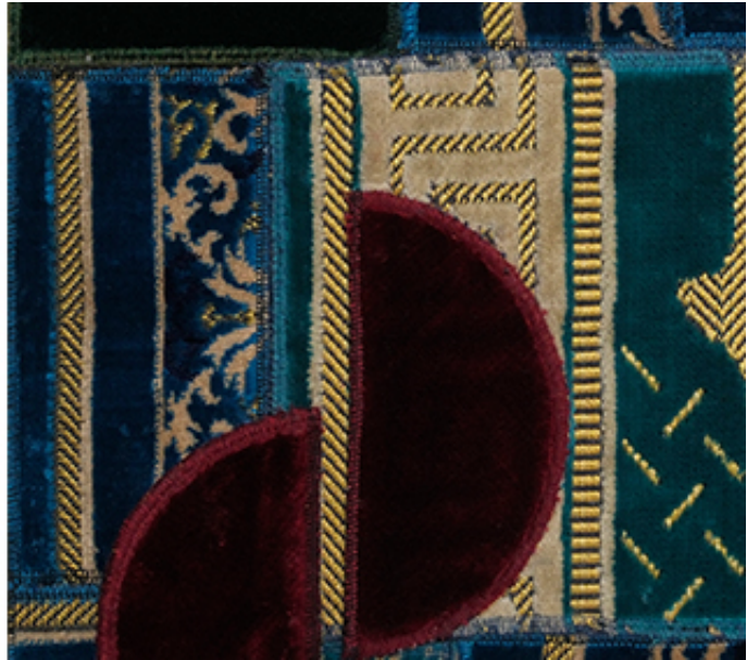
2023-2024, collage with prayer rugs, 40 x 40 cm. Courtesy of the artist.