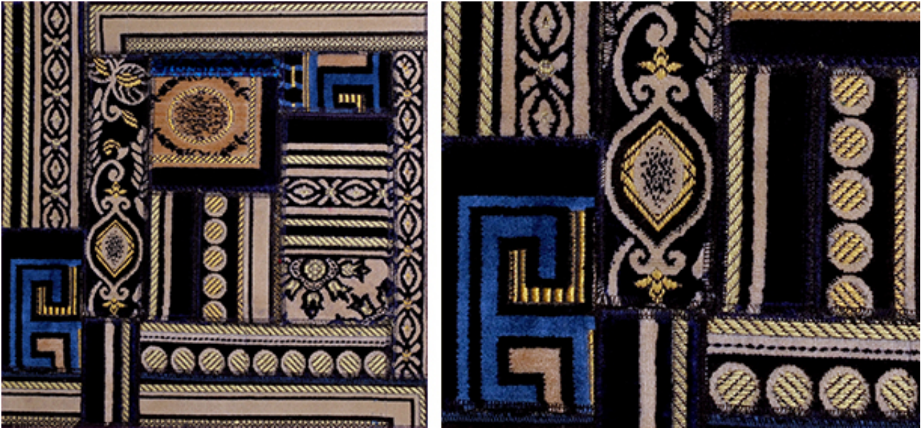
2023-2024, collage with prayer rugs, 40 x 40 cm. Courtesy of the artist.

En 2011, mounir fatmi a commencé à travailler sur une série de collages intitulés Labyrinthe , composés en utilisant des morceaux découpés de tapis de prière islamiques. Au sein des six collages qui forment cette série non achevée, on trouve une esthétique architecturale forte, avec des éléments évoquant des frontons, colonnes, plans et ornements, et pourtant chaque œuvre est visuellement très distincte des autres.