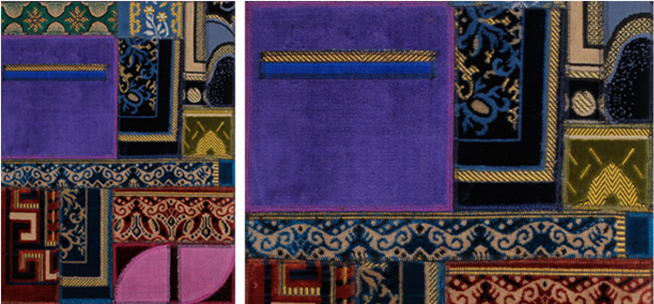
2023-2024, collage with prayer rugs, 40 x 50 cm. Courtesy of the artist.

En 2011, mounir fatmi a commencé à travailler sur une série de collages intitulés Labyrinthe , composés en utilisant des morceaux découpés de tapis de prière islamiques. Au sein des six collages qui forment cette série non achevée, on trouve une esthétique architecturale forte, avec des éléments évoquant des frontons, colonnes, plans et ornements, et pourtant chaque œuvre est visuellement très distincte des autres.