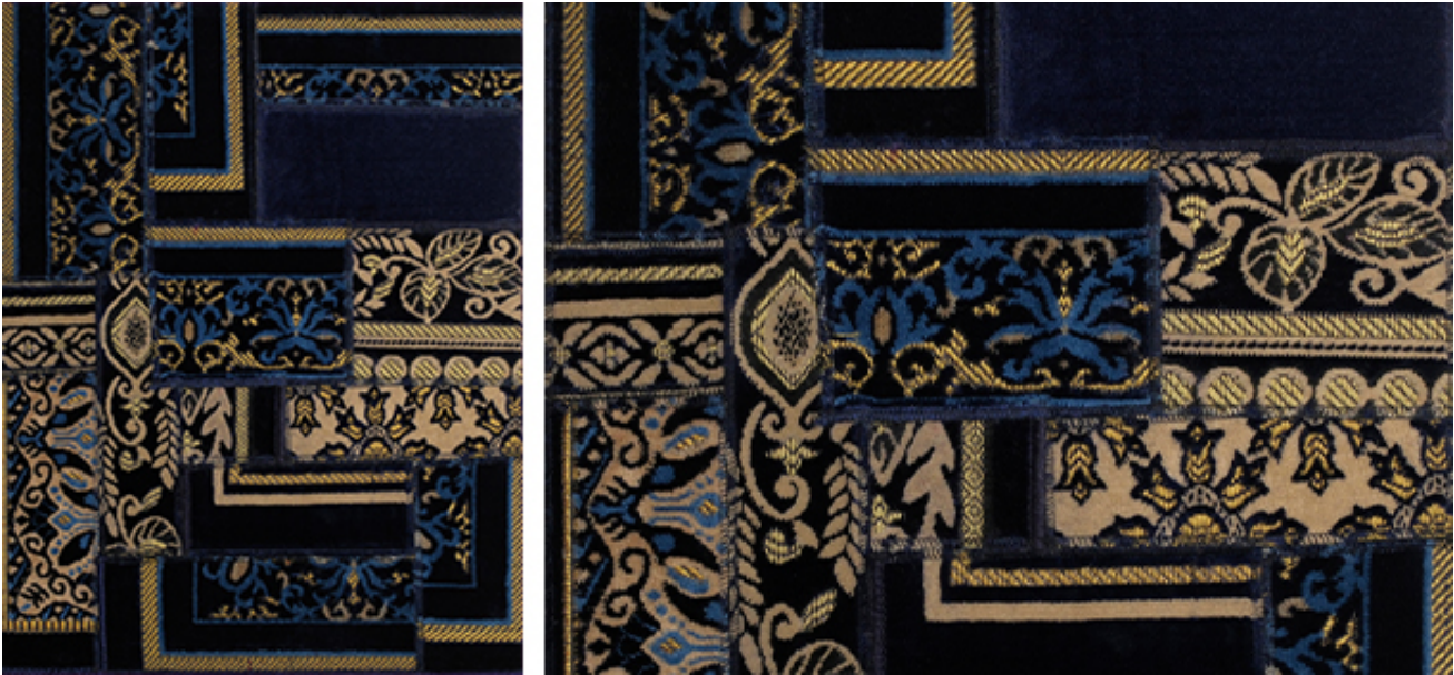
2023-2024, collage with prayer rugs, 40 x 50 cm.