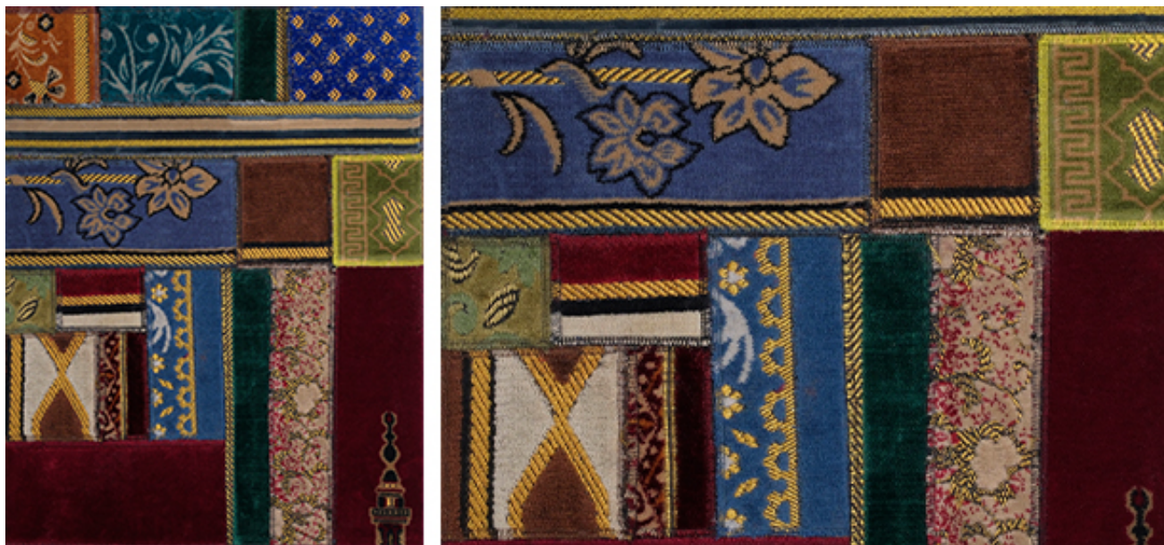
2023-2024, collage with prayer rugs, 40 x 50 cm. Courtesy of the artist.