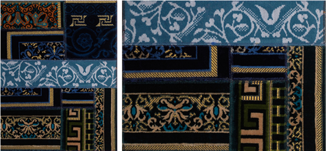
2023-2024, collage with prayer rugs, 40 x 50 cm. Courtesy of the artist.