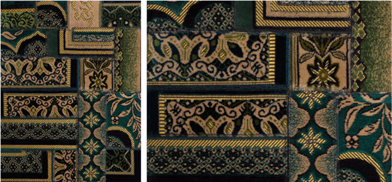
2023-2024, collage with prayer rugs, 40 x 50 cm.

En 2011, mounir fatmi a commencé à travailler sur une série de collages intitulés Labyrinthe , composés en utilisant des morceaux découpés de tapis de prière islamiques. Au sein des six collages qui forment cette série non achevée, on trouve une esthétique architecturale forte, avec des éléments évoquant des frontons, colonnes, plans et ornements, et pourtant chaque œuvre est visuellement très distincte des autres.