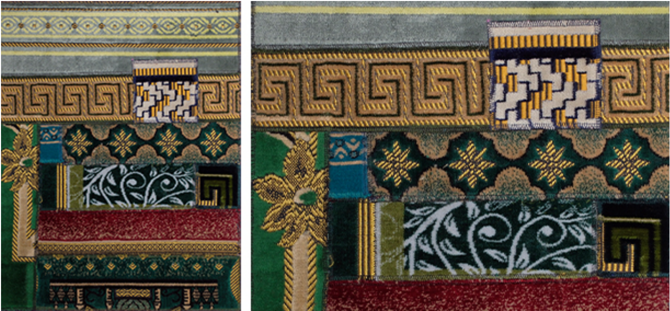
2023-2024, collage with prayer rugs, 40 x 50 cm.

En 2011, mounir fatmi a commencé à travailler sur une série de collages intitulés Labyrinthe , composés en utilisant des morceaux découpés de tapis de prière islamiques. Au sein des six collages qui forment cette série non achevée, on trouve une esthétique architecturale forte, avec des éléments évoquant des frontons, colonnes, plans et ornements, et pourtant chaque œuvre est visuellement très distincte des autres.