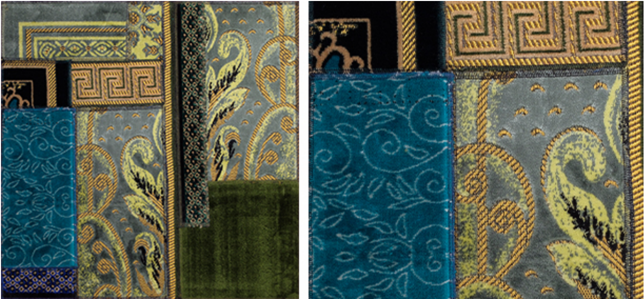
2023-2024, collage with prayer rugs, 50 x 50 cm. Courtesy of the artist.