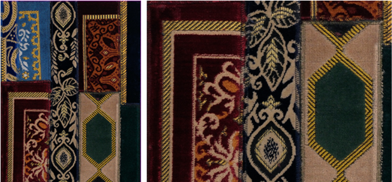
2023-2024, collage with prayer rugs, 30 x 40 cm. Courtesy of the artist.