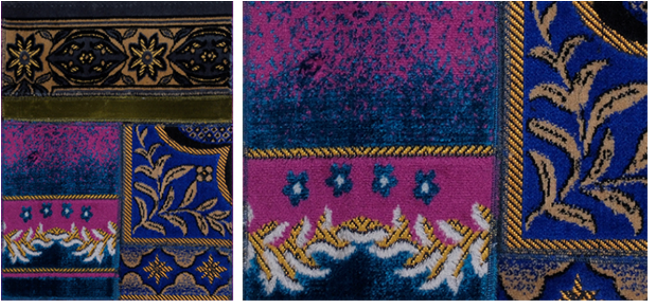
2023-2024, collage with prayer rugs, 30 x 40 cm. Courtesy of the artist.