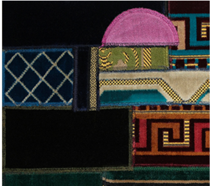
2023-2024, collage with prayer rugs, 50 x 50 cm.

En 2011, mounir fatmi a commencé à travailler sur une série de collages intitulés Labyrinthe , composés en utilisant des morceaux découpés de tapis de prière islamiques. Au sein des six collages qui forment cette série non achevée, on trouve une esthétique architecturale forte, avec des éléments évoquant des frontons, colonnes, plans et ornements, et pourtant chaque œuvre est visuellement très distincte des autres.