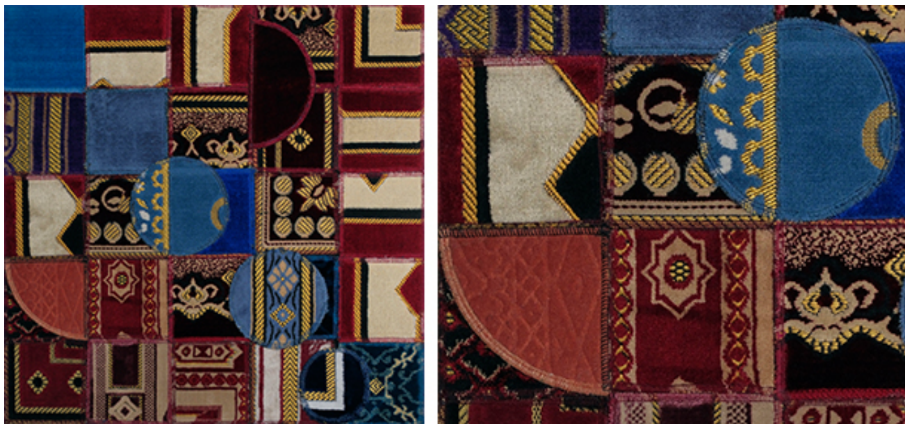
2023-2024, collage with prayer rugs, 50 x 50 cm. Courtesy of the artist.