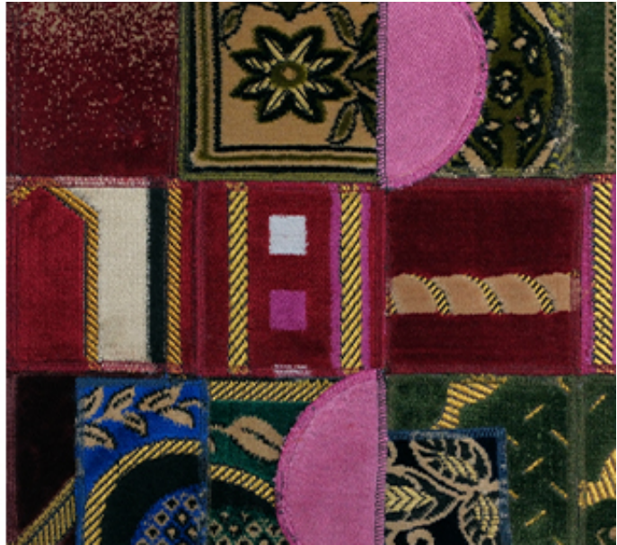
2023-2024, collage with prayer rugs, 50 x 50 cm. Courtesy of the artist.

En 2011, mounir fatmi a commencé à travailler sur une série de collages intitulés Labyrinthe , composés en utilisant des morceaux découpés de tapis de prière islamiques. Au sein des six collages qui forment cette série non achevée, on trouve une esthétique architecturale forte, avec des éléments évoquant des frontons, colonnes, plans et ornements, et pourtant chaque œuvre est visuellement très distincte des autres.