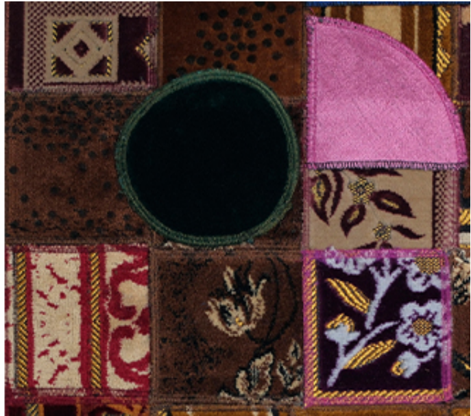
2023-2024, collage with prayer rugs, 50 x 50 cm.