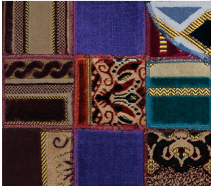
2023-2024, collage with prayer rugs, 50 x 50 cm.