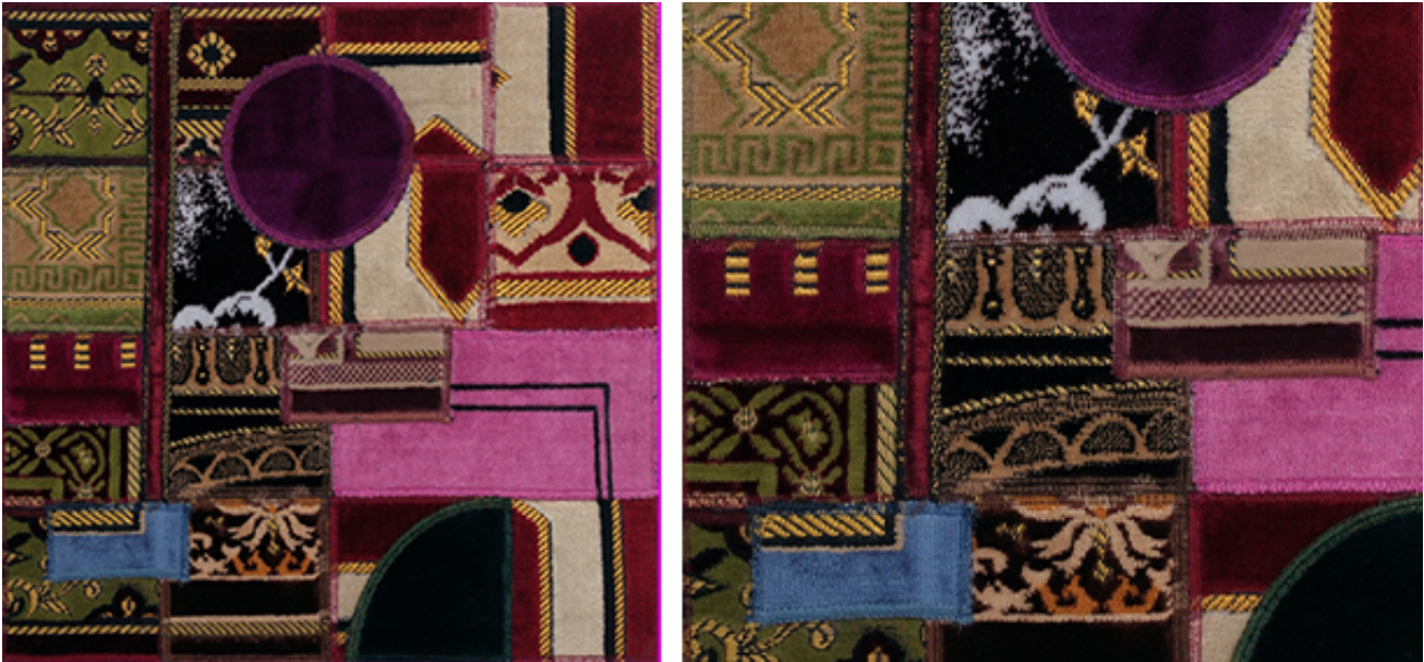
2023-2024, collage with prayer rugs, 40 x 40 cm. Courtesy of the artist.

En 2011, mounir fatmi a commencé à travailler sur une série de collages intitulés Labyrinthe , composés en utilisant des morceaux découpés de tapis de prière islamiques. Au sein des six collages qui forment cette série non achevée, on trouve une esthétique architecturale forte, avec des éléments évoquant des frontons, colonnes, plans et ornements, et pourtant chaque œuvre est visuellement très distincte des autres.