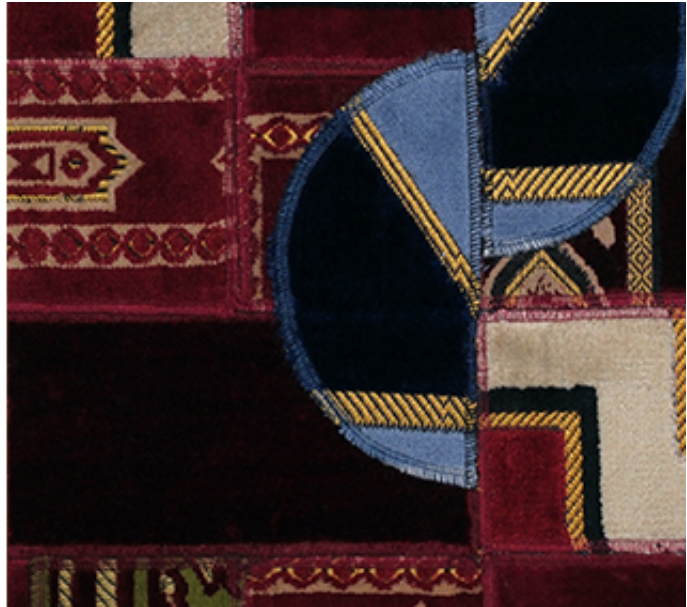
2023-2024, collage with prayer rugs, 40 x 40 cm. Courtesy of the artist.