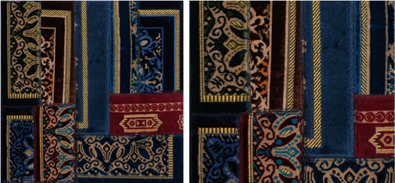
2023-2024, collage with prayer rugs, 40 x 40 cm. Courtesy of the artist.