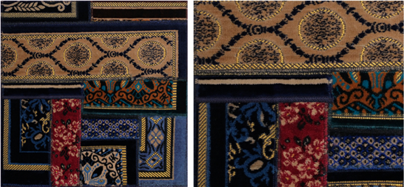
2023-2024, collage with prayer rugs, 40 x 40 cm.