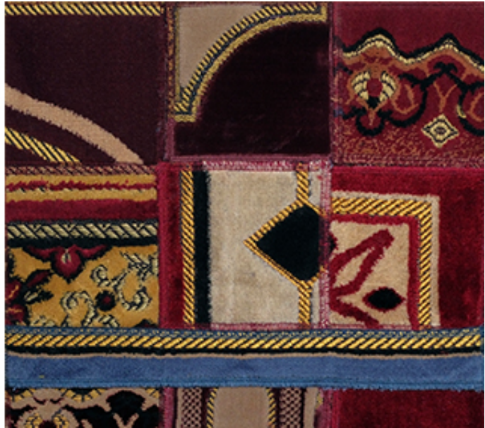
2023-2024, collage with prayer rugs, 40 x 40 cm.