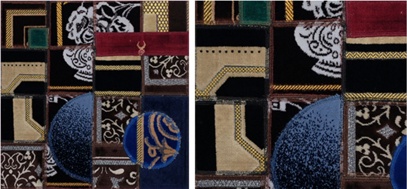
2023-2024, collage with prayer rugs, 40 x 40 cm. Courtesy of the artist.