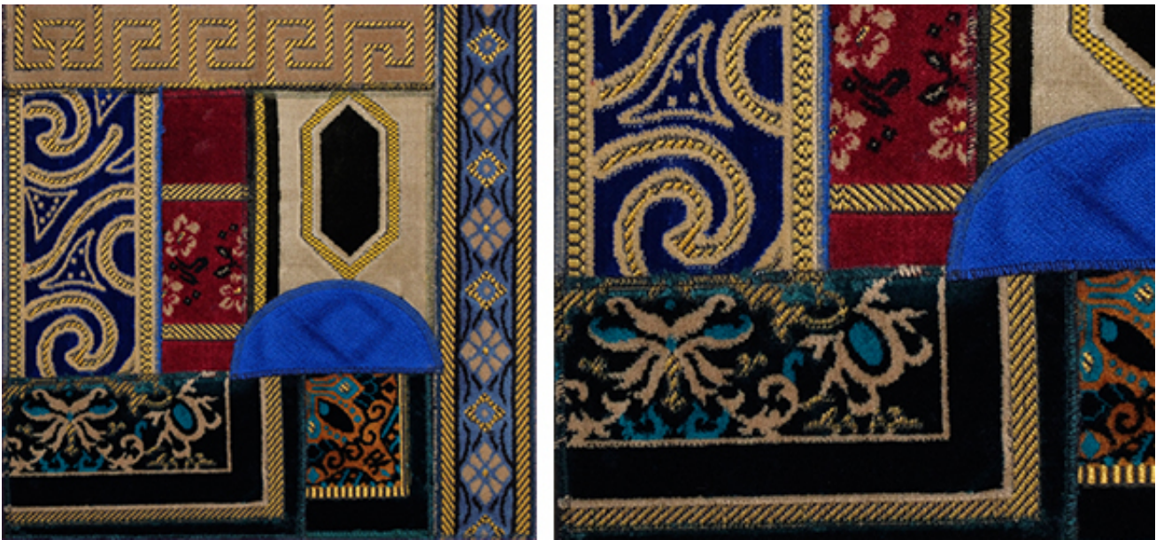
2023-2024, collage with prayer rugs, 40 x 40 cm. Courtesy of the artist.