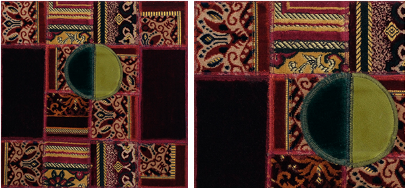
2023-2024, collage with prayer rugs, 40 x 40 cm.

En 2011, mounir fatmi a commencé à travailler sur une série de collages intitulés Labyrinthe , composés en utilisant des morceaux découpés de tapis de prière islamiques. Au sein des six collages qui forment cette série non achevée, on trouve une esthétique architecturale forte, avec des éléments évoquant des frontons, colonnes, plans et ornements, et pourtant chaque œuvre est visuellement très distincte des autres.