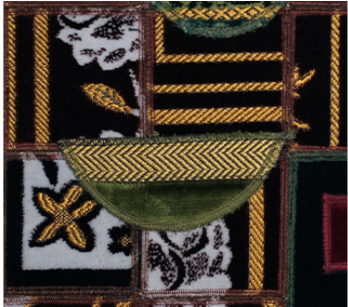
2023-2024, collage with prayer rugs, 40 x 40 cm.