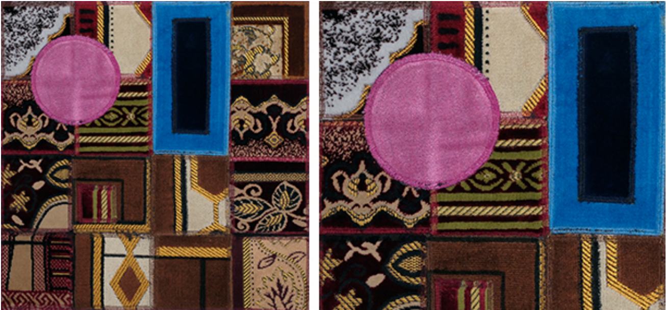
2023-2024, collage with prayer rugs, 40 x 40 cm.