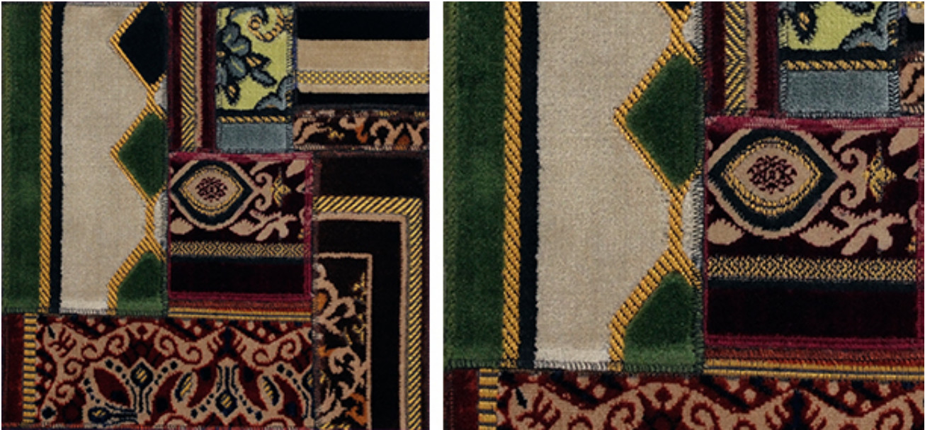
2023-2024, collage with prayer rugs, 30 x 30 cm.