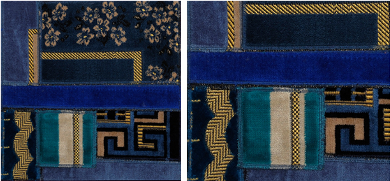
2023-2024, collage with prayer rugs, 30 x 30 cm.