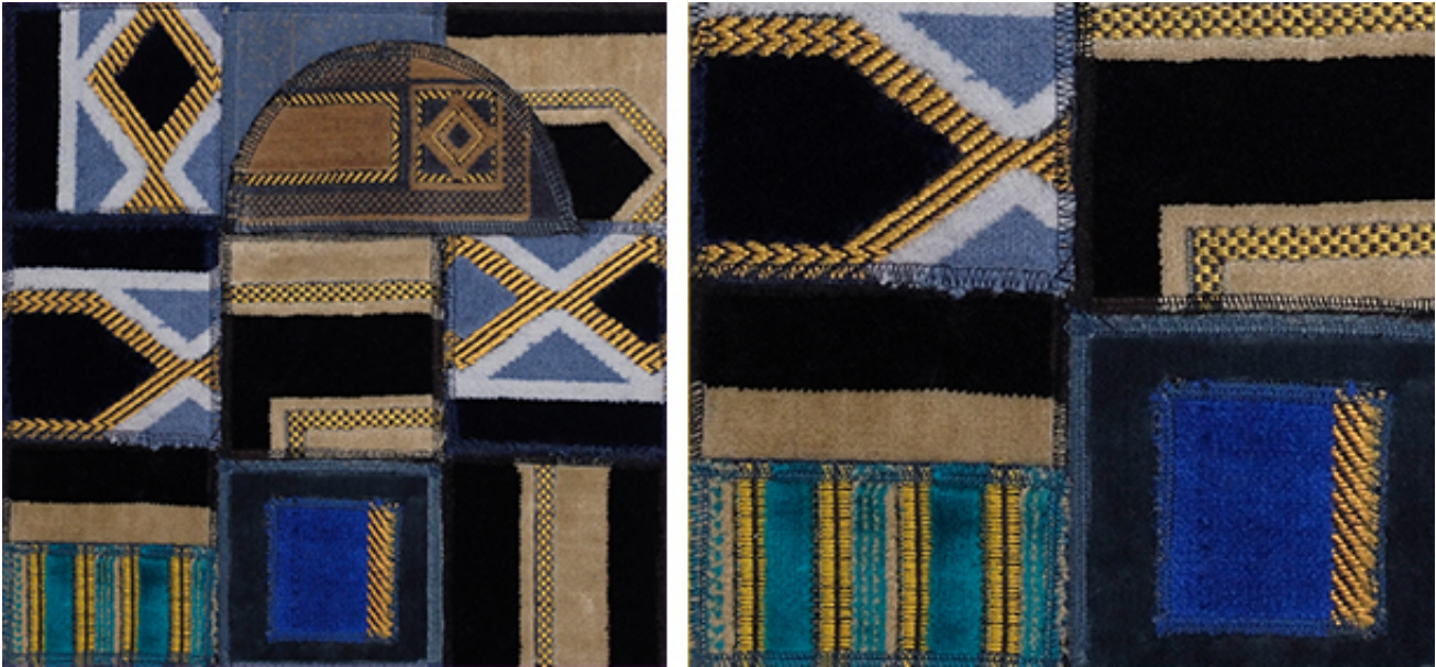
2023-2024, collage with prayer rugs, 30 x 30 cm. Courtesy of the artist.