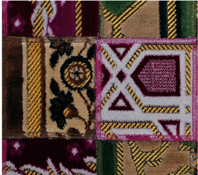
2023-2024, collage with prayer rugs, 30 x 30 cm.