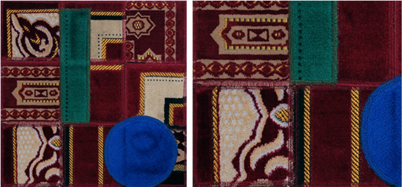
2023-2024, collage with prayer rugs, 30 x 30 cm.