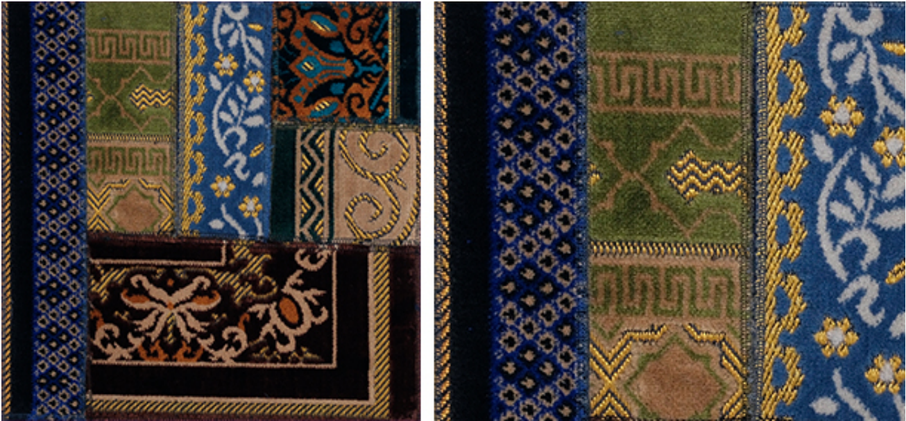
2023-2024, collage with prayer rugs, 30 x 30 cm. Courtesy of the artist.