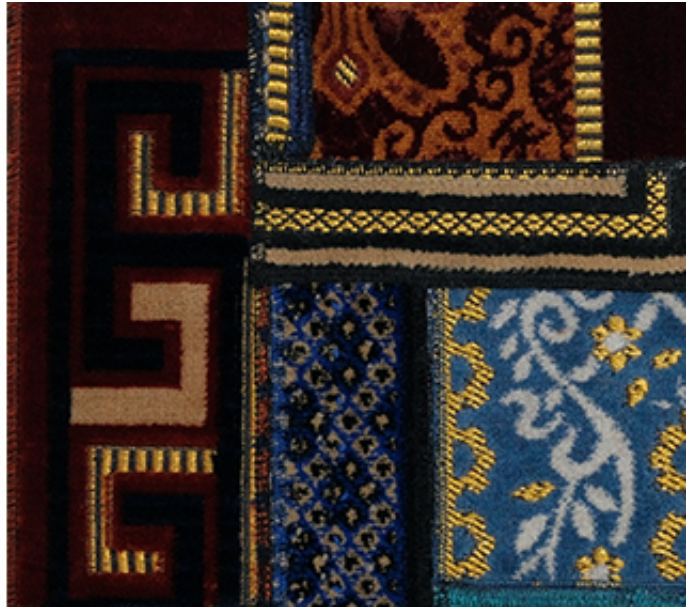
2023-2024, collage with prayer rugs, 30 x 30 cm.