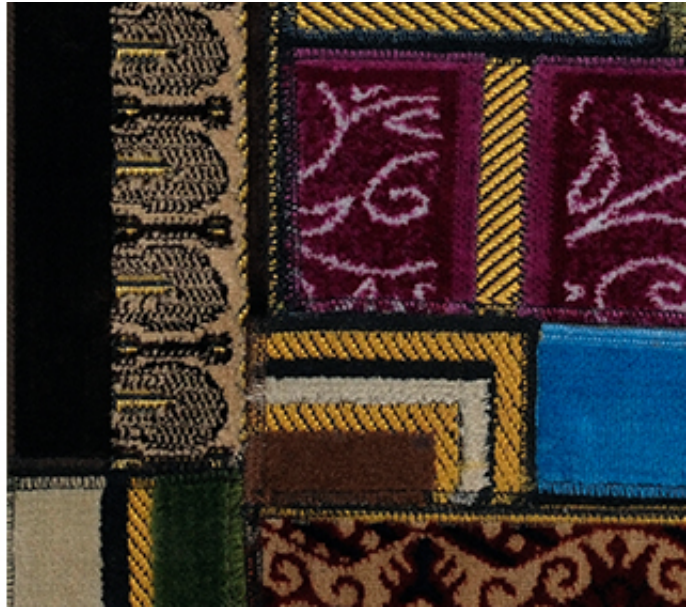
2023-2024, collage with prayer rugs, 30 x 30 cm. Courtesy of the artist.