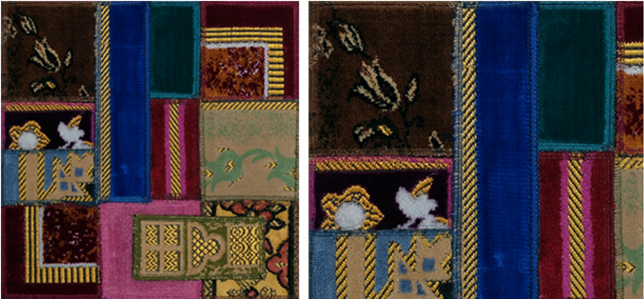
2023-2024, collage with prayer rugs, 30 x 30 cm. Courtesy of the artist.